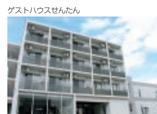
ゲストハウスせんたん