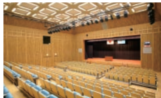
入学式や学位記授与式、会議、講演などを行うことができる、多目的ホールです。