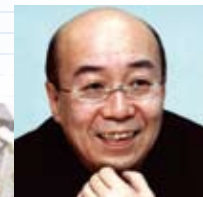
鷺田清一氏 大谷大学教授 前大阪大学総長