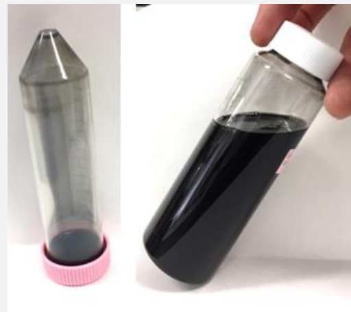
図 1. 有機溶媒テトラヒドロフランに収率 100% で分散した単層カーボンナノチューブの分散液（右）。遠心分離（13,000×g）を行った後、遠心チューブの底に不溶物が見られない（左）。

本研究では効率よく条件の最適化を行うために実験を工夫しました。CNT インク中に含まれる CNT の量を簡便に計測するために、分散液の光吸収（吸光度測定）を利用しました。この方法により短時間に分散濃度に関する定量的なデータセットが得られます。実際にはエチルセルロースを分散剤として、吸光度データセットから 81 種類の溶媒依存性を調べました。さらにその解析に情報技術を取り入れて単純なパラメータ（変数）のみの相関関係を表す線形回帰を行い、また、モデルの複雑さを段階的に増やすことにより、できるだけ少ない変数でのモデルを構築しました。このために、機械学習の手法である遺伝的アルゴリズムとベイズ学習の観点で特徴量選択を行いました。これらの検証を通じ、CNT の分散特性を高精度に予測可能なモデルを構築することに成功しました（図 2A）。またインク化に必要な化学パラメータは溶媒ごとに異なりますが、AI で絞り込まれた化学パラメータ群で規定された溶媒を、可視化手法である t-SNE により二次元平面に写像することで、似た分散メカニズムをもつ溶媒群の可視化・グループ化（図 2B）にも成功しました。