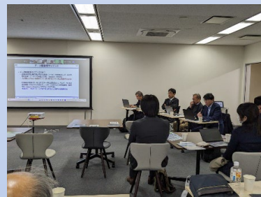
富谷先生の発表の様子