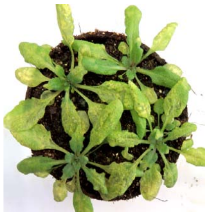
糖吸収に欠損のあるシロイヌナズナ変異体が病原細菌に感染されている写真